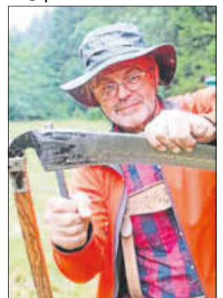
Abbildung: (Mario Knoll)

Im Seminar erlernen Sie die Grundlagen des Dengelns sowie das Einstellen und Reparieren der Sense. Dengelutensilien und Übungssensen werden gestellt. Eigene Sensen, Dengelböcke und Zubehör können zur Begutachtung mitgebracht werden. Der Kurs findet im Freien statt.