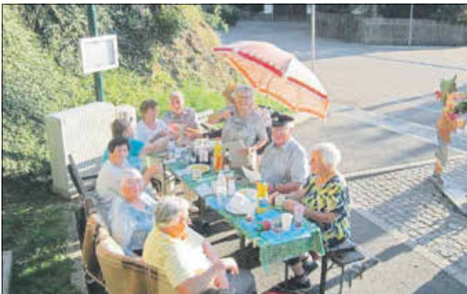
Die diesjährige Feier am Fuße des Kirchberges.

Zurück zum Beiersdorfer Stiftungsfest – Bei sommerlichen Wetter feierte die Pyramidengruppe im Ortszentrum das Jubiläum. Einer der Höhepunkte des Nachmittags, neben den Salamander reiben, war zweifelsohne die Ankunft der durch ein Mitglied der Gemeinschaft gesponserten Roster, die die Kameraden der FFW zubereiteten. Das wiederum spiegelt den Zusammenhalt der Ortsvereine und die gute Kameradschaft untereinander wieder. Die Wehr hatte sich spontan dazu bereit erklärt.