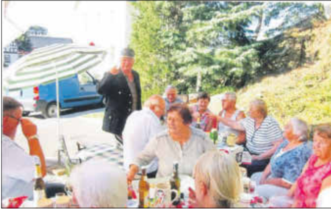
Eine frühere Aufnahme zu Ehren des Stiftungsfestes der Beiersdorfer FFW.

In Beiersdorf setzte sich dieser Ritus, im Kreis der Wehr, nach den schweren Jahren des 1. WK und der darauf folgenden Weltwirtschaftskrise durch. Man war des militärischen Drills als Folge des Krieges überdrüssig und suchte die Geselligkeit, die sich dann auch bei der FFW durchsetzte. Wann und warum dieser Brauch abbrach ist nicht genau bekannt. Sicher sind die Ursachen im folgenden Krieg und den Notjahren danach zu suchen.