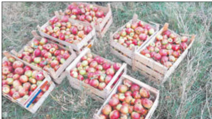
Abbildung: Äpfel von der Streuobstwiese (Autor André Oehler)

Selbstgemachtes schmeckt immer noch am besten! Also ab ins Freie Äpfel sammeln, mit der Ernte in die Gräfenmühle kommen und mit Hilfe der mobilen Saftpresse unserer Freunde aus Mildenaу am Wochenende eigenen Apfelsaft herstellen. Für alle Besucher, ob mit oder ohne Saftobst, ist an diesen Tagen das Mühlencafé, mit frisch gebackenem Kuchen, geöffnet.