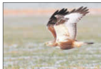
Abbildung: Raufußbussard