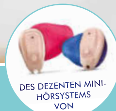
DES DEZENTEN MINI-HÖRSYSTEMS VON

eines WIDEX Im-Ohr-Hörsystems mit modernster Technologie für eine herausragende Klangqualität und ein ausgezeichnetes Sprachverständnis.