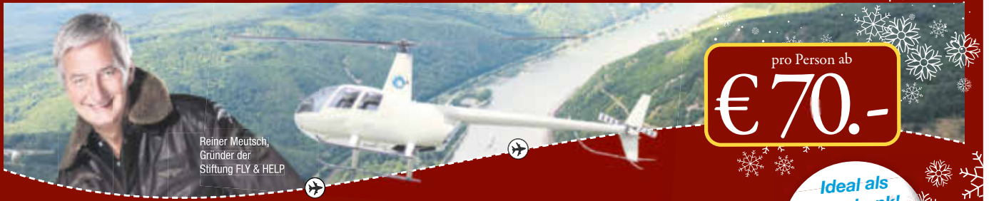
Reiner Meutsch, Gründer der Stiftung FLY & HELP