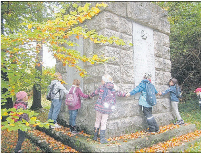
EGLO-Grundschule Fraureuth Zwickauer Str. 6 * 08427 Fraureuth