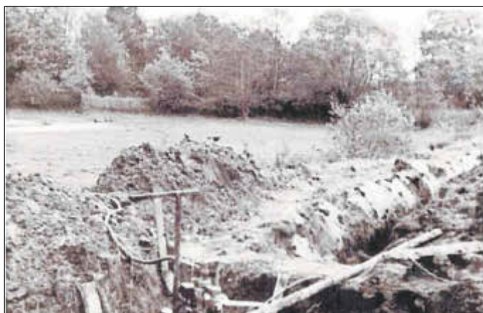
Erster Bauabschnitt im Bereich Aschbrunnen/Tuchfabrik Beiersdorf.

Also mussten alle Schachtarbeiten manuell durchgeführt werden. Heute unvorstellbare 6260 m Hauptleitung und 9570 m Nebenleitung wurden mit Hacke und Spaten geschachtet. Lediglich im Bereich der Hochbehälter wurde gesprengt. In den nächsten Monaten/Jahren waren täglich 60 Bürger im Einsatz, an den Wochenenden bis zu 140 Helfer.