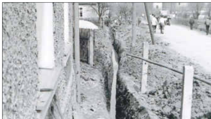
Zweiter Bauabschnitt Oberdorf Beiersdorf in Höhe der Ortslagen Nr. 26b und 26d

Im Folgejahr ging es zügig weiter. Trotz der dauernden Materialknappheit wurde der am 15.04.1969 begonnene 2. Bauabschnitt am 25.11.1969 beendet.