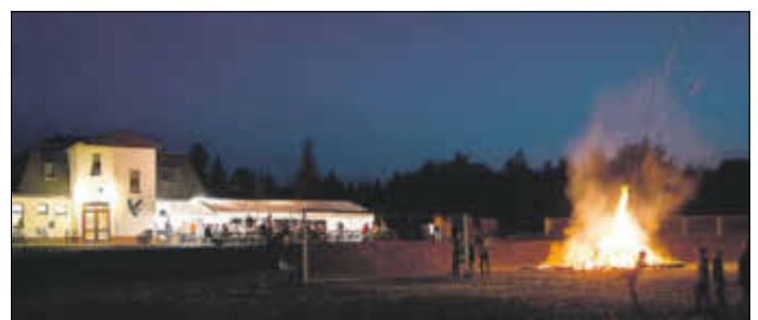
So sah es früher zum Hexenfeuer aus!

Wie bereits angekündigt wird der VfB Eintracht die Tradition der Hexenfeuer vor der Kegelbahn fortführen. Allerdings sind die großen Feuer ja bekanntlich nicht mehr möglich, sodass der Verein auf eine Variante mit mehreren kleinen Feuerchen ausweicht. Im Oktober bereits erfolgreich erprobt hoffen wir am 30. April auf viele Besucher, gute Gespräche und ein geselliges Miteinander bei Roster, Steak, Bier und Glühwein.