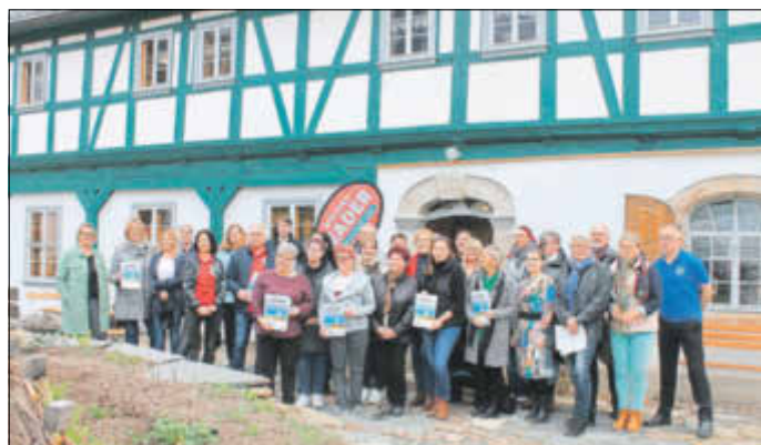
Aufstellung der PreisträgerInnen im diesjährigen LEADER-Ideenwettbewerb „HeimatVerein(t) für die Zukunft“ am 31. März 2023, im Geyerhaus in Weißbach