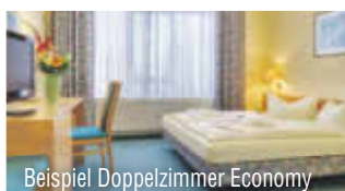
Beispiel Doppelzimmer Economy