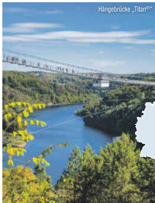
Hängebrücke „Titan“ RT

H1 = Doppelzimmer Haus 1, SUP = Doppelzimmer Superior EZ-Zuschlag: 10 €/Nacht Kurtaxe: ca. 2-3 € p. P./Nacht (saisonal)