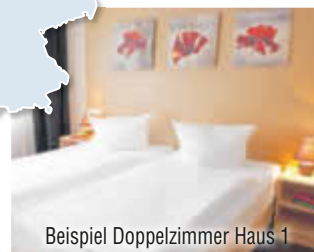
Beispiel Doppelzimmer Haus 1