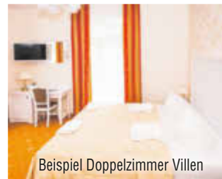
Beispiel Doppelzimmer Villen