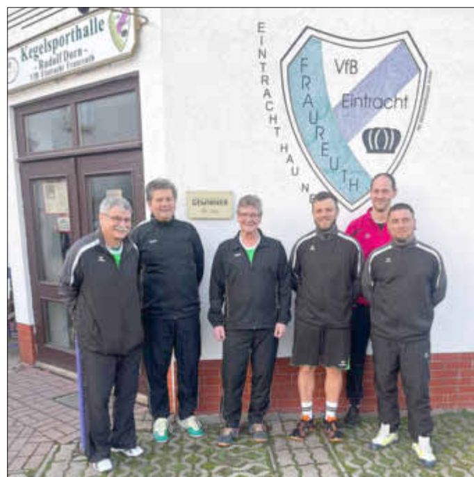
Die Fraureuther Zweite vor dem „Gewinner“-Schild, welches jetzt die „Rudolf Dorn“ Halle ziert.

den Sportlern, Übungsleitern und Funktionären, den Eltern unserer Nachwuchssportler, den Sponsoren, kommunalen Vertretern und allen nichtgenannten Helfern bedanken – verbunden mit den besten Wünschen für ein erfolgreiches 2024.