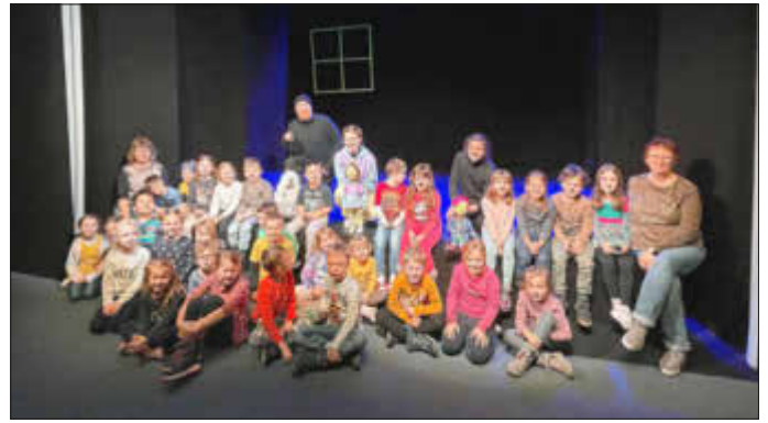
Die Erzieherinnen der ABC-Gruppen „Kinderland“ und „Glücksbärchen“

Eine magische Stunde und viel Staunen bereitete den Kindern das emotionale sowie zauberhafte Puppenspiel „Frau Holle“ mit den ungleichen Schwestern Glücksmarie und Pechmarie, die so allerhand erlebten und sich weiterentwickeln konnten. Es gab einige komische Momente zum Schmunzeln und Lachen, ob das der wirklich lustige Ofen war, dessen Brote fertig gebacken waren, der Hund, welcher die beiden Schwestern anstatt des Hahnes mit Gebell begrüßte oder der Apfelbaum mit seiner schweren Last. Die Kinder konnten durch die weise „Frau Holle“ erfahren, dass Freundlichkeit sowie Liebe eine erschaffende, schöpferische Kraft ist, während negative Gefühle, wie Missgunst und Abneigung, zerstörerisch wirken können. So ging unsere Glücksmarie mit einem goldenen Samen nach Hause, den sie aber mit ihrer Stiefschwester teilte, die durch diese liebevolle Geste emotional dazulernen und umdenken konnte.