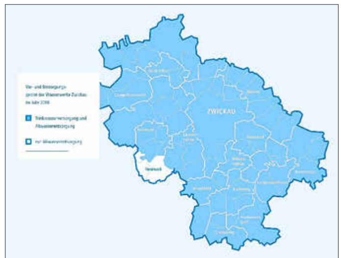
Bild: Trinkwasserver- und Abwasserentsorgungsgebiet der Wasserwerke Zwickau -

Das Versorgungsgebiet der Wasserwerke Zwickau umfasst die Orte Crimmitschau, Crinitzberg, Fraureuth, Hartenstein, Hartmannsdorf, Hirschfeld, Kirchberg, Langenbernsdorf, Langenweißbach, Lichtentanne, Mülsen, Neukirchen, Reinsdorf, Werdau, Wildenfels, Wilkau-Haßlau und Zwickau. Unser Entsorgungsgebiet ist identisch mit dem Versorgungsgebiet - mit einer Ausnahme: Die Gemeinde Neumark betreuen wir nur abwasserseitig.