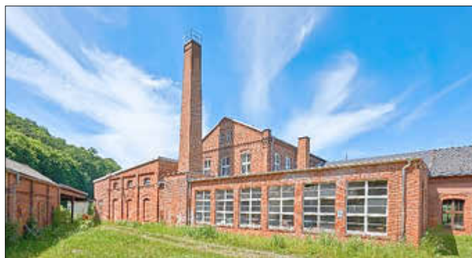
Bild: Wasserwerk Wiesenburg

Heute stammt der weitaus größte Teil unseres Trinkwassers von den Zweckverbänden Fernwasser Südsachsen und Fernwasser Thüringen. Ergänzt wird dieses durch Wasser aus Tiefbrunnen.