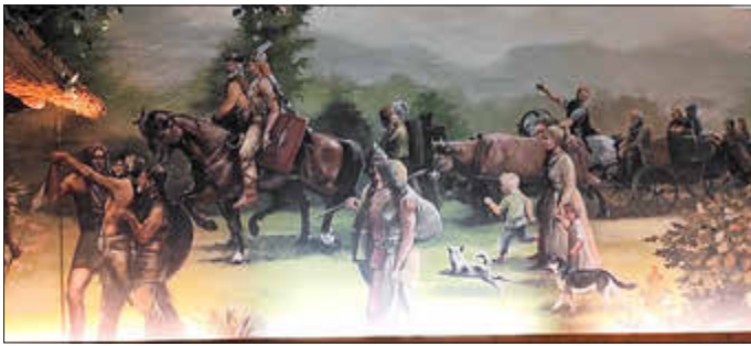
Wandbemalung im Hotel