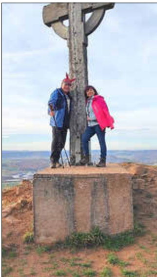
Auf dem Öchsen