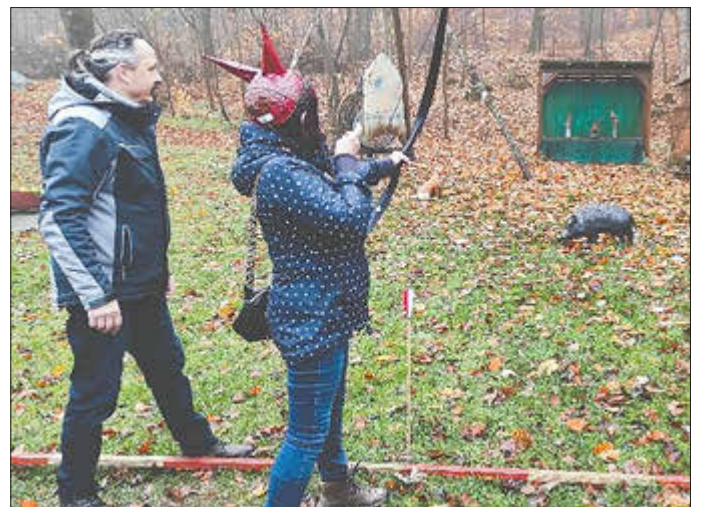
Bogenschießen auf Attrappen

Der dritte Tag begann mit Bogenschießen. Nach einer kurzen Einweisung „erlegten“ wir Wildschweine, Füchse und schossen auf eine Scheibe. Anschließend gab es Glühwein vom Hotelwirt. Die anschließende Wanderung nach Vacha führte uns zur Brücke der Einheit.