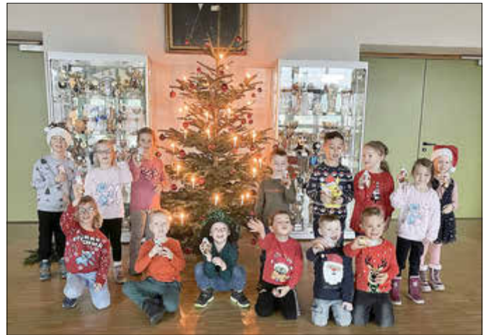
Kinder der Kita „Regenbogen“ freuen sich über ihren Auftritt bei unserer Weihnachtsfeier.

Wir freuen uns auf unseren nächsten Spielenachmittag am 07. Januar 2026, 14:30 Uhr im Foyer der EGLO-Halle.