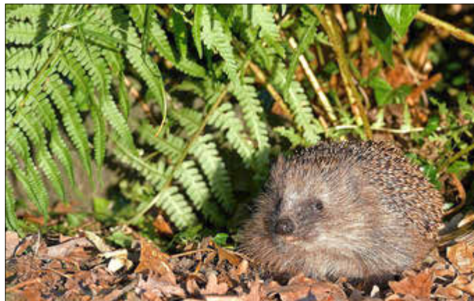
Igel auf Nahrungssuche

Weitere Informationen zu diesem Thema sind zu finden unter www.igelverein.de www.bund-naturschutz.de/oekologisch-leben/naturgarten